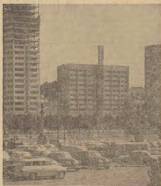
Wschodnia strona ul. Marszałkowskiej, począwszy od Al. Jerozolimskich do Świętokrzyskiej, jest w tej chwili olbrzymim placem budowy. Tzw. „Wschodnia ściana” zabudowana nowoczesnymi gmachami i wieżowcami, stanie się nowym akcentem architektonicznym miasta. (Ch)