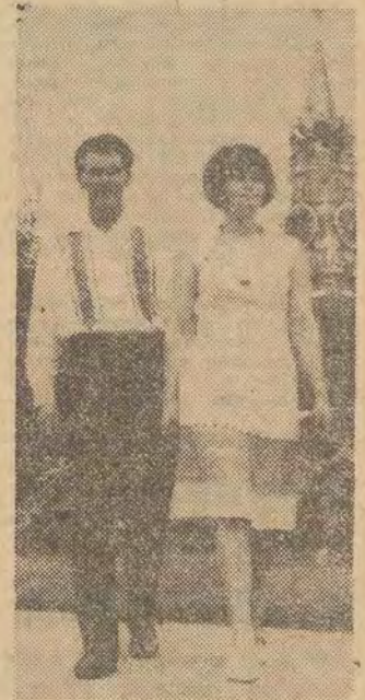
Tak będą ubrani „na co dzień” radzieckie olimpijczycy w Tokio.