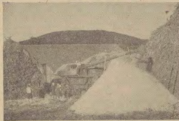
Na zdjęciu: omloty w gospodarstwie Państwowego Ośrodka Hodowli Zarodowej w Pakoszewce.