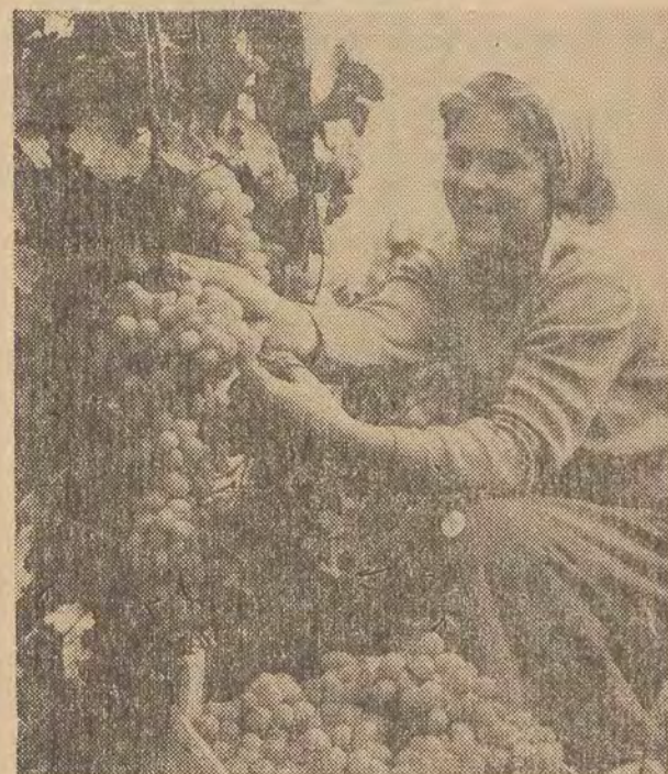
Piękne i bardzo smaczne są winogrona z rozległych winnic w Peruszczyca, na południe od Pławidw.

Polskę łączą z Bułgarią więzy ekonomiczne. Polsko-bułgarska współpraca gospodarcza rozwija się w ramach dwustronnych umów, podpisanych w marcu 1960 r. na lata 1961-65. W roku ub. postanowiono zwiększyć przewidziane w niej wzajemne dostawy towarów (na lata 1961-65) o dalsze 32 proc.