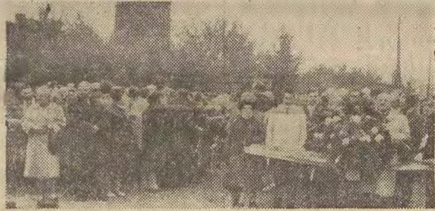
Składanie wieńców na Cmentarzu Żydowskim.