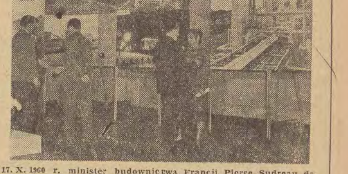
17. X. 1960 r. minister budownictwa Francji Pierre Sudreau dokonał otwarcia w salach rezydencji Teatru Narodowego w Warszawie wystawy współczesnej architektury i urbanistyki francuskiej. Na zdjęciu: fragment wystawy.