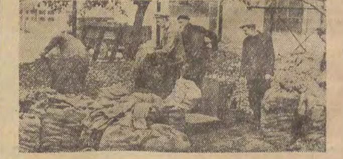
ZIEMNIAKÓW NIE ZABRACNIE

Wszystkich łodzian zobowiązuje do udziału w tej pięknej pracy zaszczytne wyróżnienie — Order Budowniczych Polski Ludowej. Łódź musi nie