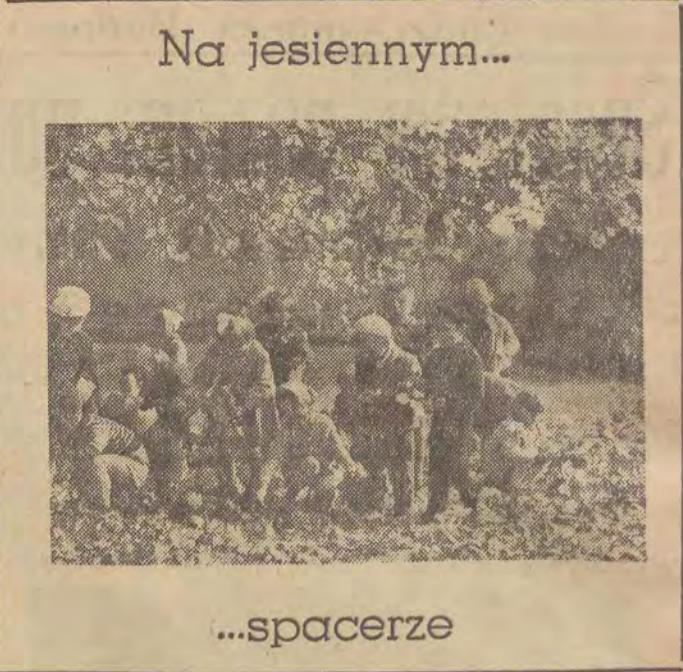
Na jesiennym... spacerze

Nie załam dziwnego, że Bałuty przodują w wykonywaniu zadań porządkowych i zajęły pierwsze miejsce w Łodzi. Za trud i pełną poświęcenia pracę w imieniu Komitetu Łódzkiego PZPR, złożył podziękowanie