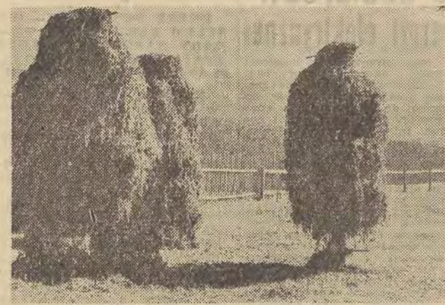
W jesiennym słońcu... CAF — fot. Olszewski