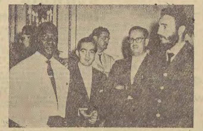
Prezydent Gwiney Sekou Toure w czasie swojej niedawnej wizyty na Kuby (pierwszy z prawej Fidel Castro).