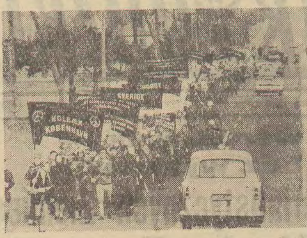
Fragment trzydniowego marszu przeciwników zbrojeń atomowych, w którym wzięły udział tysiące osób z: Danii, Szwecji, Finlandii, Norwegii, Islandii, NRF, Grecji i W. Brytanii. Marsz ten odbył się na 65-kilometrowej trasie Holbaek — Kopenhaga.