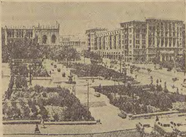
W Azerbajdżanie w okresie panowania władzy radzieckiej nastąpiły wielkie przemiany gospodarcze i kulturalne.