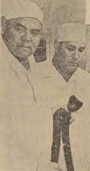
25 lat pracuje we frunzeńskim szpitalu miejskim chirurg-profesor Isa Achunbajew (drugi z lewej). Syn biedniaka-koczownika zajął dzięki wytrwałej pracy stanowisko akademika Kirgiskiej Akademii Nauk i członka-korespondenta Akademii Nauk Medycznych ZSRR. Napisał 55 prac naukowych. — Profesor przeprowadza najtrudniejsze operacje serca.