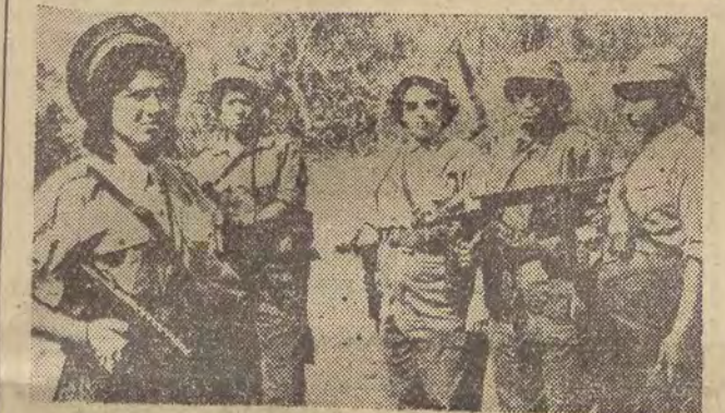
Na zdjęciu: kobiety oddziału wojskowego na pozycji.