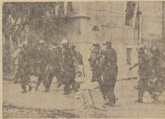
Na ulicach Algieru doszło w dniu 11. XI. br. do zamieszek, wywołanych przez skrajnie nacjonalistyczne elementy. Władzom z trudem udało się przywrócić porządek.