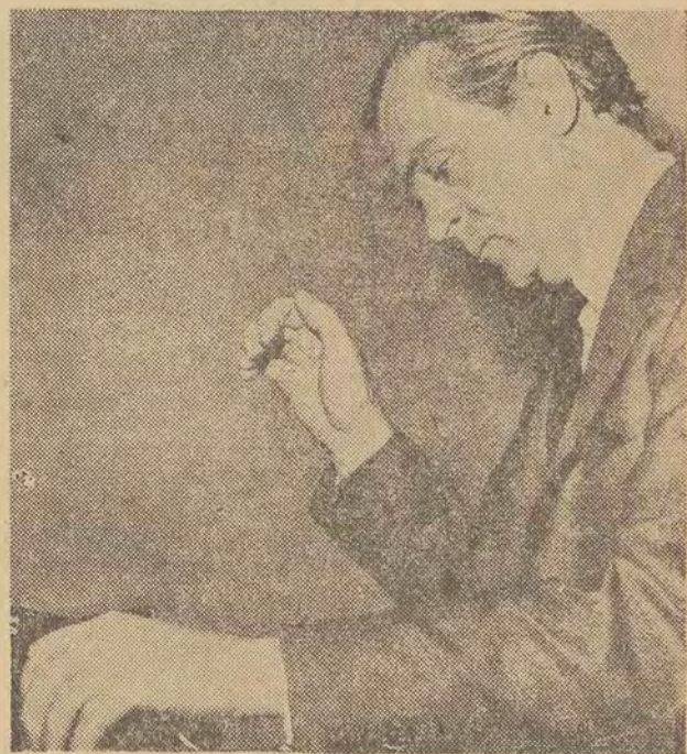
I znowu zawitał do Łodzi Witold Małcużyński, by w sali Filharmonii, wypełnionej do maksimum pojemności, dać recital fortepianowy. Przed dwoma i pół laty gościliśmy go w Łodzi po raz pierwszy, oklaskując gorąco występ artysty. Od tego czasu pianista był w Polsce jako członek jury Konkursu Chopinowskiego, a obecnie przyjechał znowu, tym razem tylko na występy. To „tylko“, to 17 recitali w ciągu trzech tygodni. A więc tournée bardzo pracowite.