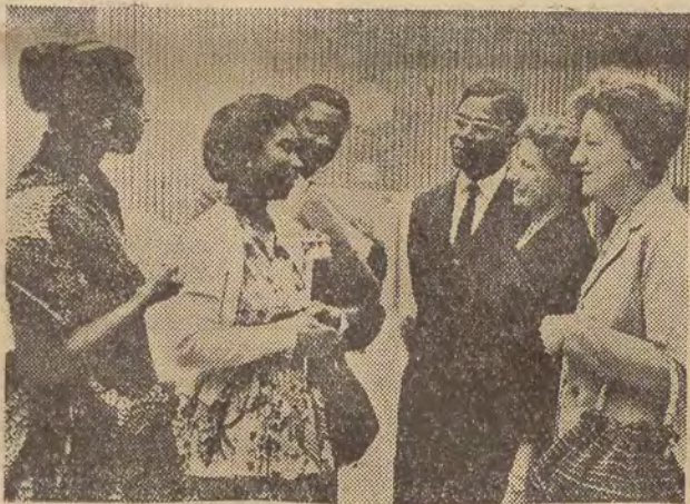
Wśród coraz liczniejszych w ONZ kobiet-delegatek, zwracają uwagę przedstawicielki Czarnej Afryki. Na zdjęciu przedstawicielki Ghany w rozmowie z delegatkami Australii i Nowej Zelandii.