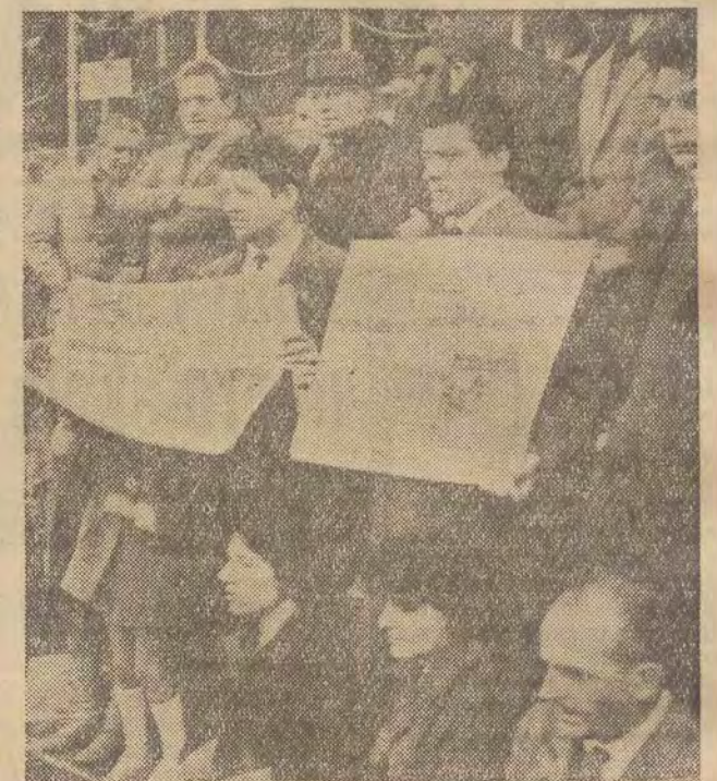
We Francji mnożą się demonstracje przeciw bazom Bundeswehry na ziemi francuskiej. Na zdjęciu: manifestacja w miasteczku Orange (Francja południowa).