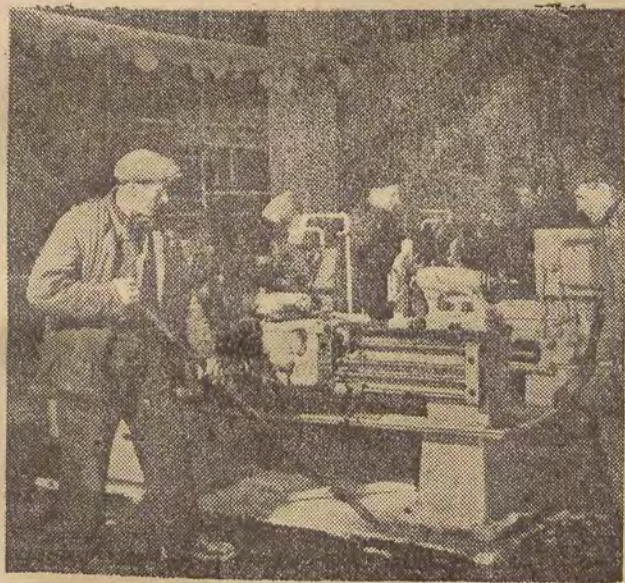
Budowę Łódzkich Zakładów Mechanicznych Włókien Sztucznych podjęto w celu uruchomienia produkcji części dla maszyn do maszyn produkujących włókna sztuczne oraz produkowania prototypów nowych maszyn włókienniczych. Przewidziane jest skrócenie czasu budowy zakładów o 8 miesięcy i oddanie ich do eksploatacji w początkach 1961 roku.

Na zdjęciu: ustawienie tokarki TR 45 produkcji Wielkopolskiej Fabryki Maszyn.