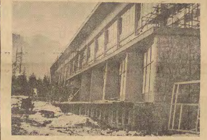
W związku z mającą się odbyć w 1961 r. Spartakiadą Armii Zaprzyjaźnionych, przyspieszono budowę wielkiego kombinatu sportowego w Zakopanem — Ośrodka Wyszczolenia Sportowego GKKEP. Na zdjęciu: ogólny widok internatu.