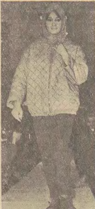
Taki strój na narty opracowało Centralne Biuro Wzornictwa Przemysłu Lekkiego. CAF-FOT: Langda

Trzeba już przygotować narty. Łódzkich amatorów narciarstwa zainteresuje