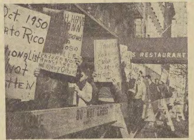
Fragment demonstracji przed gmachem ONZ w Nowym Jorku, której uczestnicy wyrażają poparcie dla walki narodu kubańskiego, protestując przeciw próbom interwencji amerykańskiej w wewnętrzne sprawy Kuby.