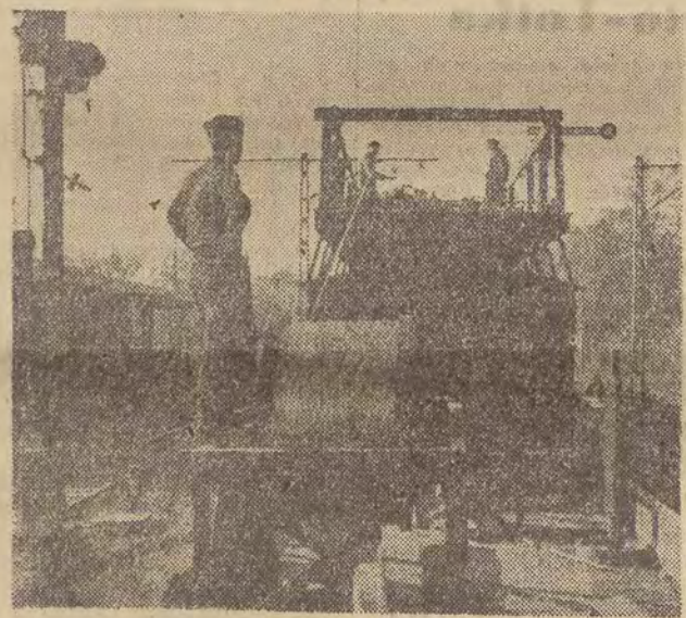
Prace przy elektryfikacji linii kolejowej Katowice — Gliwice — Wrocław dobiegają końca. Obecnie na kilku odcinkach wymienia się szyny oraz montuje sieć elektryczną na dworcach w Opolu i Groszowicach. Na zdjęciu: zawieszanie trakcji elektrycznej na Dworcu Głównym w Opolu.