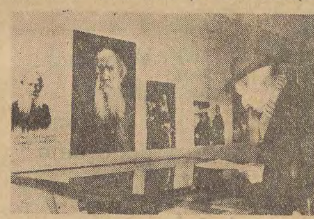
W salach Bibliothque Nationale w Paryżu, została otwarta wystawa pamiątek po Lwie Tolstoju z okazji 50 rocznicy śmierci pisarza.