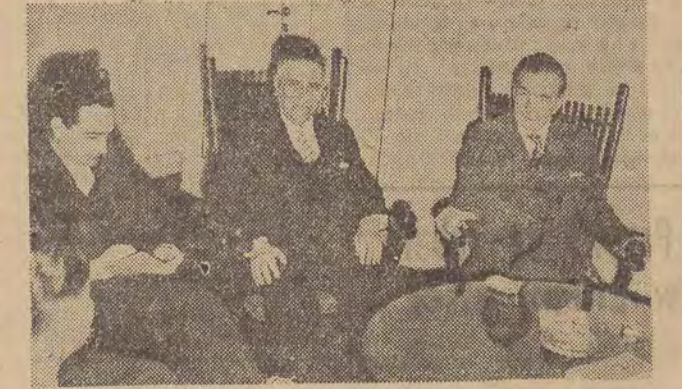
W dniu 19 grudnia 1960 roku minister spraw zagranicznych Adam Rapacki przyjął bawiącą w Polsce kubańską delegację gospodarczą, której przewodniczy wiceminister spraw zagranicznych Hector Rodriguez Llompart.

Polska dostarczać będzie Kubie sprzęt elektrotechniczny, maszyny rolnicze, kombajny, maszyny górnicze, wagony kolejowe, maszyny budowlane, obrabiarki, sprzęt transportowy i inne. Ponadto eksportować będziemy na Kubę dozwolone żywność — m. in. bekony, mączkę ziemniaczaną, kazeinę oraz przemysłowe artykuły konsumpcyjne trwałego użytku (radioparady, kucharki gazowe itp.).