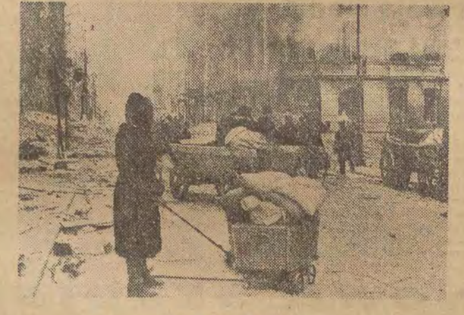
Pierwsze powroty...