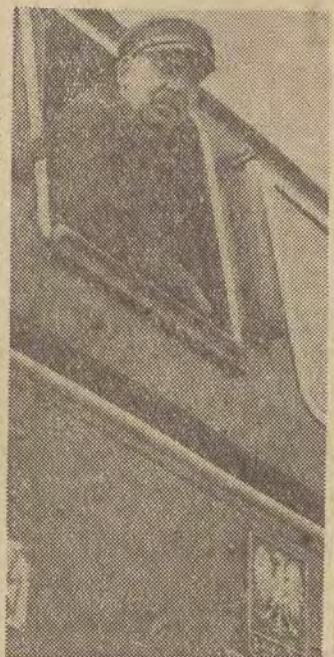
(Dalszy ciąg na str. 4)