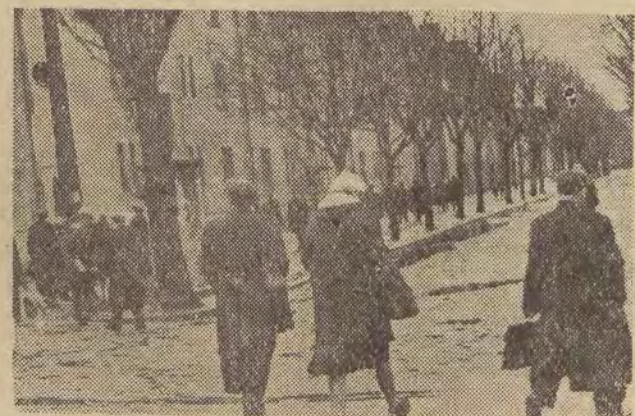
Przyjechał „pendel”. Tłum pasażerów wysypał się na ulice, które za chwilę znowu opustoszeją.

W latach trzydziestych związało się „Francusko-Polskie Towarzystwo Kolejowe”, które postanowiło wybudować najkrótsze połączenie Śląska z Gdynią. Chodziło oczywiście o transport węgla. 350-kilometrowa linia przecięła „jak strzał”, nie zbaczając ku żadnemu miastu, połać kraju od Herb Nowych do Bydgoszczy. Na „stolicy” tej linii wyznaczono Karsznice. Ziemia tu była jałowa, błotnista i dziedzićce wyżył się jej za grosze. W roku 1932 przystąpiono do budowy parowozowni, a nieco później zaczęły wyrastać pierwsze bloki dla kolejarzy. Zaplanowano tych bloków aż 70, zaplanowano nawet połącze nie tramwajowe ze Zduńską Wolą i Sieradzem, by zapewnić dowóz pracowników z tych miejscowości. Wojna przeszkodziła planom dalszej rozbudowy, a miasteczko, rzucane w krainę bezludną, pozostało na zawsze tym, na co je skazał kaprys budowniczych — kosza-