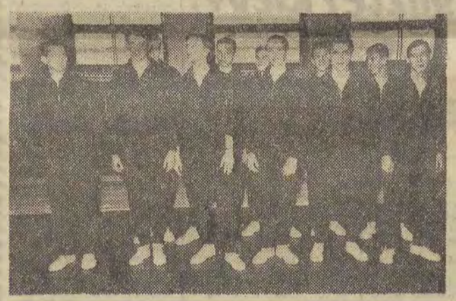
Koszykarze MKS MDK po zdobyciu tytułu mistrza Polski drużyn szkolnych, zapewnił sobie obecnie mistrzostwo juniorów okręgu łódzkiego.