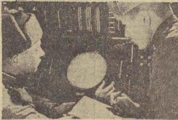
Fragment szkolenia — przy radio-pelengatorze.

Pierwsza w świecie armia robotników i chłopów — Armia Radziecka — narodziła się 23 lutego 1918 roku.