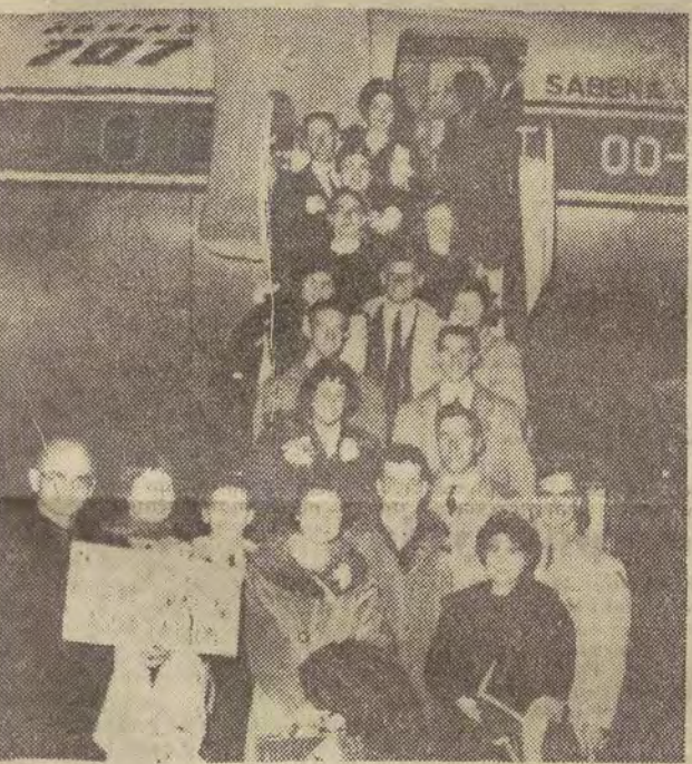
Ekipa amerykańskich lyżwiarzy figurowych na lodzie na chwilę przed odlotem z Nowego Jorku 14 bm. na mistrzostwa świata w Pradze. Jak wiadomo, zginęli oni wszyscy w katastrofie lotniczej nad Brukselą.

J a, wie pan, nie lubię jazdy po ciągach. Wole samochodem. I tylko dlatego, że oddałbym teraz wóz do remontu... — Czy to się panu opłaca? — Oczywiście, kalkulacja jest prosta. „Mój” pali dziesięć na sto. Za liter benzyny płacę 3 złote... — Jak to, przecież oficjalnie cena jest wyższa? — Owszem, owszem. Tylko, widzi pan, z benzyną to u nas bywa tak... W tym miejscu zażywny przeciwnik podróży kolejowej zniżył głos. Do dalszych miejsc dobiegły tylko strzępki rozmowy, tłumionej przez monotony stukot kół rozpedzonego pociągu.