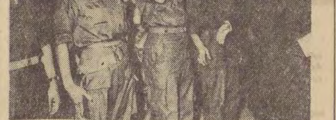
Podczas walk w pobliżu Xieng Khouang wojska sojuszni ckie kapitana Kong Le i jednos'ki Patet Lao rozbiły 6 od działów wojsk rebelianckich, które usiłowały opanować Do linę Amfor. Na zdjęciu: premier Laosu książę Souvanna Phouma (z prawej) wśród żołnierzy po zwycięskiej bitwie pod Xieng Khouang.

Dla wykonania tych poważ nych zadań (a wymieniliśmy tu tylko niektóre) rady naro dowe będą musiały nadal u macniać swą rolę gospodarzy terenu. (as)