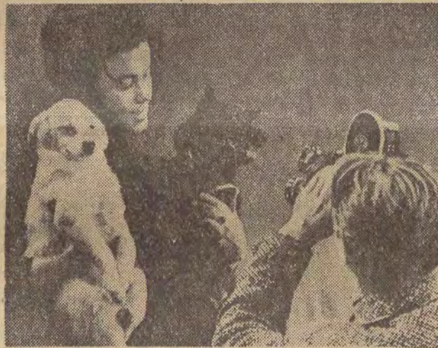
„Czernuszka”, pasażer IV radzieckiej automatycznej rakiety kosmicznej — wystąpiła przed kamerami telewizji w Moskwie wraz z Tiszką (z lewej), szczeniakiem Striełką.