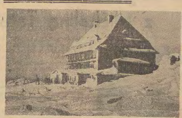
W dniu wczorajszym otrzymaliśmy kartkę z pozdrowieniami od instruktorów Komendy Chorągwi Łódzkiej ZHP przebywających na kursie-konferencji w Cieplicach. Nasi czytelnicy-druhowie m. in. piszą: