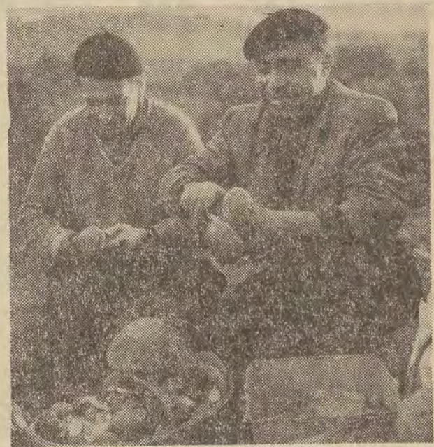
...z wyprawy na grzyby!