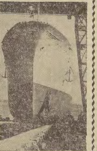
Kolejny dziesięcioletni-czytnik wybudowany w stoczni War-now splywa z pochylini.