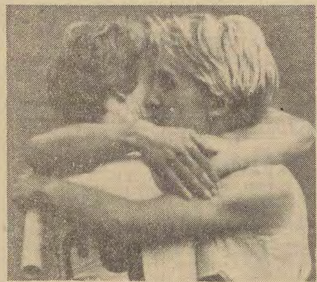
Złote medalistki Klobukowska i T. Ciepla uradowane i szczęśliwe ze zwycięstwa w biegu sztafetowym 4 x 100 m.

★ POWIEŚĆ „DZIENNIKA” ★ POWIEŚĆ „DZIENNIKA” ★ POWIEŚĆ „DZIENNIKA” ★ POWIEŚĆ „DZIENNIKA” ★ POWIEŚĆ „DZIENNIKA” ★ POWIEŚĆ „DZIENNIKA”