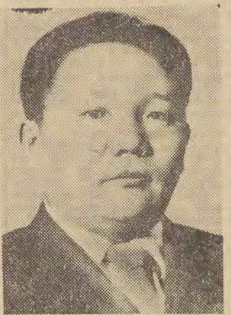
I sekretarz KC Mongolskiej Partii Ludowo-rewolucyjnej, przewodniczący Rady Ministrów MRL — Jumżagijn Cedenbał.

brzeże gdańskie, woj. poznańskie i Dolny Śląsk.