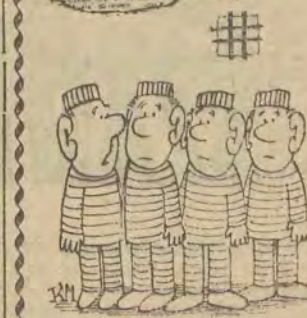
— Pierona! Ładnego urobku żęśmy się dofredowali!

Proces — gigant kołczy łódzka afera węglowa