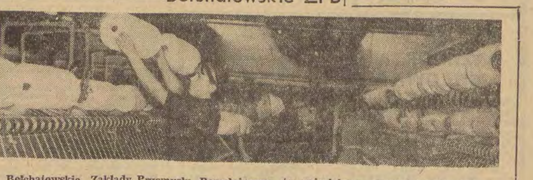
Bełchałowski Zakłady Przemysłu Bawelnianego, to największe przedsiębiorstwo w tym rejonie, rozbudowane i zmodernizowane w ostatnich latach, zatrudniające około 2500 osób (większość kobiet). Spora część produkcji z zakładów przeznaczona jest na eksport, w tym największej do Związku Radzieckiego, Kanady, Holandii i Skandynawii. Na zdjęciu: nowa przędzalnia w ZPB w Bełchałowie.

częściowo wykluczona zostałaby Francja”.