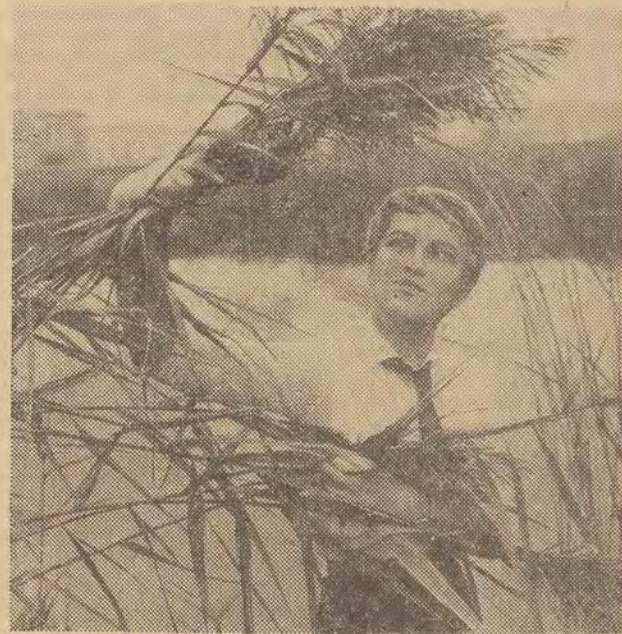
pięknie dekorują mieszkania