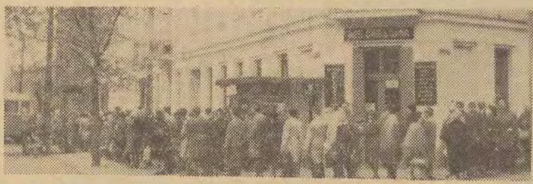
Na przystanku autobusowym przy ul. Lutomiarskiej.

Kolejka do autobusu kończy się aż na ul. Zachodniej. Oczekiwanie w godzinach „szczytu” popołudniowego. Wiedzy niełatwo jest dostać się na Żubardź. Przypadłoby się tu więcej „Sanów”, które by usprawniły komunikację w tym osiedle. j. kr.