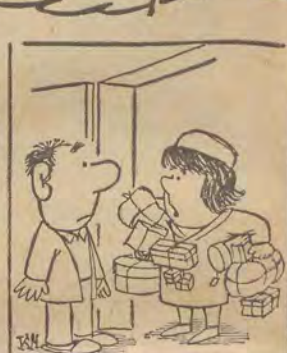
— Co się tak gapisz? Przecież miesiąc oszczędzania już się skończył!