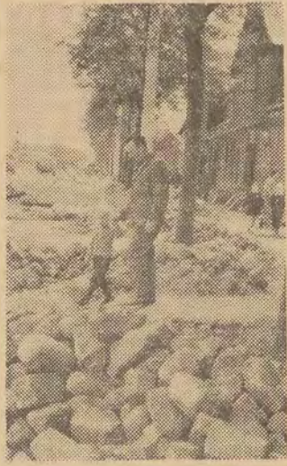
pisanych „atrakcji” możemy dołączyć codzienne, bezpłatne zwiędzanie tartaku, obok którego przebiega ulica.

Przez ulicę przechodzą tory kolejowe. W godzinach rannych i popołudniowych stoją tu wagony i przez nie to właśnie przeprawiają się przechodnie. Do o-