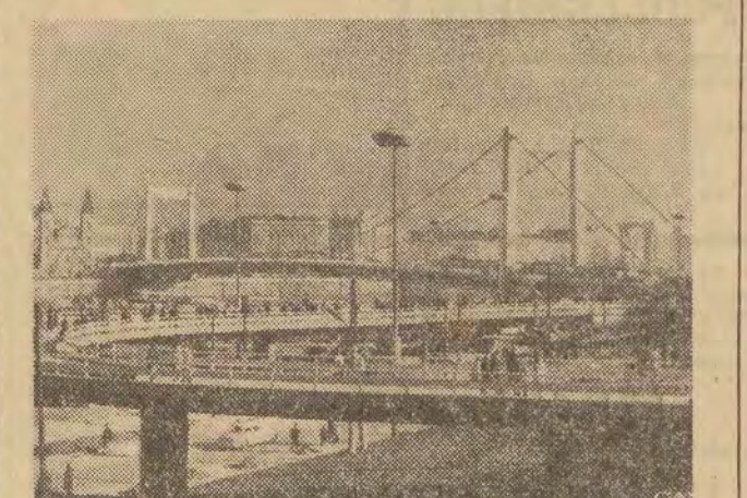
21 listopada oddany został do użytku nowo odbudowany most Elżbiety w Budapeszcie. Na zdjęciu: widok mostu i specjalnych miejsc dla pieszych.