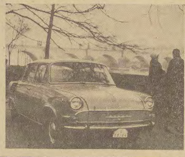
CAF - fot. Staszyszyn