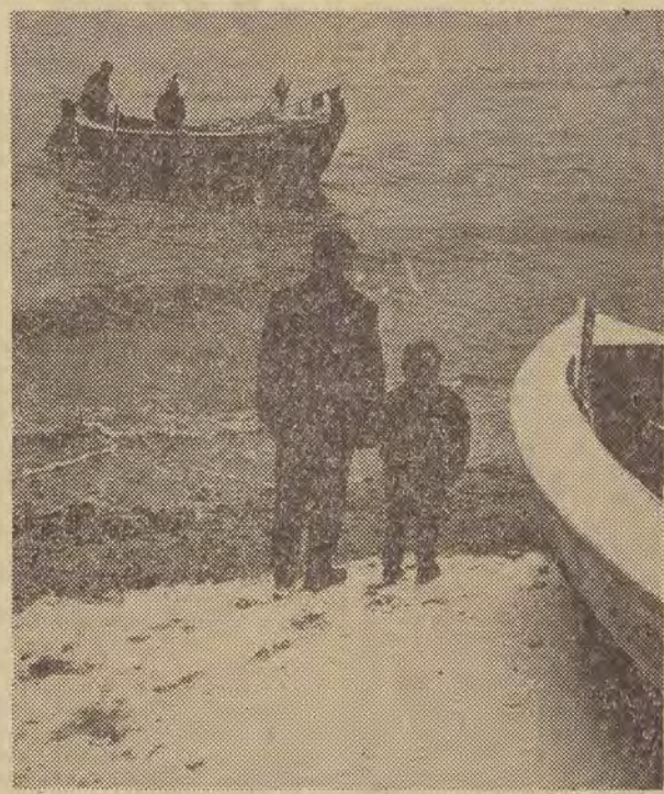
Chociaż zima w pełni, to jednak każdy pogodniejszy dzień rybacy wykorzystują na połow węgory. Na zdjęciu: łodzie wypływają na połow węgory z Zatoce Gdańskiej.