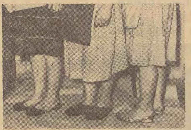
Takie obuwie, wbrew pozorom, nie przynosi ulgi nogom zmęczonym całodzienną pracą. Odpowiednie pantofle dla pracownic są nieodzowne, jeśli higiena pracy ma być właściwie pojmowana.