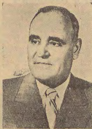
Gheorghe Gheorghiu-Dej