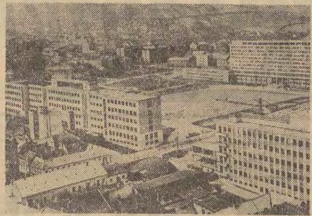
Na zdjęciu: nowoczesne bloki mieszkalne w Bratysławie.

Nasz południowy sąsiad — Czechosłowacka Republika Socjalistyczna — nie należy do krajów wielkich. Zajmuje ona terytorium wynoszące zaledwie 0,08 proc. powierzchni lądów kuli ziemskiej; 13 i pół miliona ludności CSRS stanowi zaledwie pół procent ludności świata.