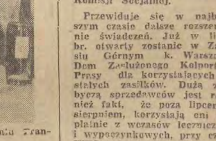
Taki oto składzik z wódką znaleziono w mieszkaniu Franciszki Rychwalskiej.

DZIAŁKOWICZE I WŁASNICIELE OGRÓDKÓW! POLEWACZKI ogrodnicze a 105 zł — Wojska Polskiego 68. Przybyszewskiego 42. GRABIE ogrodnicze a 18 i 20 zł — Bałucki Rynek 1, Narutowicza 16, Główna 44. ŁOPATY do piasku, a 29.10 zł — Wojska Polskiego 68. BRAMY żelazne w cenie 2.060, 2.110 oraz 2.335 zł można kupić w składach materiałów budowlanych — Kilińskiego 48 i Bato-rowskiego 68. SZTYFT przeciw potowi firmy Uroda „Desodor” perfumowany w cenie 14 zł — Piotrkowska 16, Plac Wolności 9. KORKI do butelek różnych rozmiarów nabędziecie — Główna 52, Armii Czerwonej 100, Rzgowska 51, Andrzeja Struga 43.