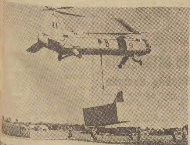
Na lotnisku Villacoublay (Francja) odbył się pokaz uniwersalnej kabiny służącej do transportu rannych drogą lotniczą. Kabina ta wyposażona jest w sprzęt chirurgiczny pozwalający na dokonywanie operacji.