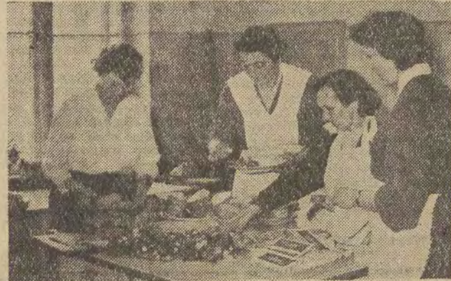
NA ZAPLECZU — jak zwykle w takich okolicznościach — działają zdenerwowane mamy. Dla swoich córek i synów w wielką troską przygotowują, bogate w witaminy, drugie śniadania. A na osłode „ciężkiego losu” dokładają do każdej porcji po kawalku dobrej czekolady.