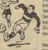
Wiedzący to sobie szczerze, skromnie. Grali ambitnie ofiarnie, bojowo, lecz polotu cechującego zespół przeciwny nie można było u nich dostrzec. Zwłaszcza w pierw-

Główny błąd gości polegał na tym, że atak w miarę zbliżania się do bramki polskiej, zwalniał tempo. W niedzielnej rozgrywce miało to decydujące