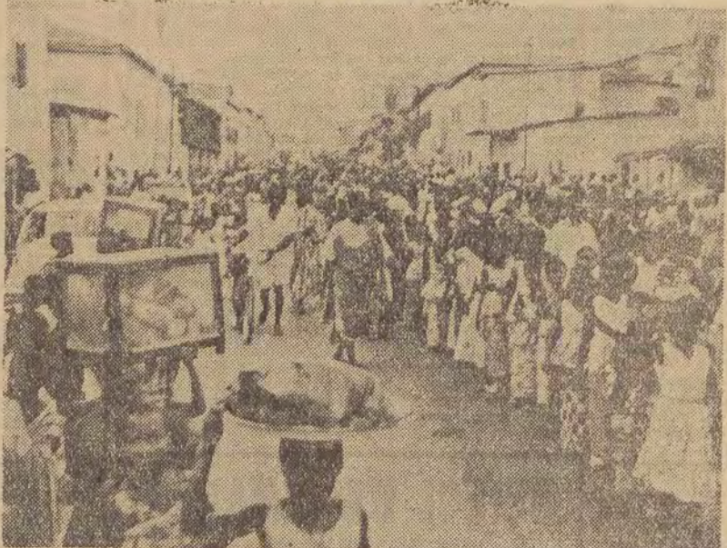
Na zdjęciu: trudności ładowania — pokonane — a przed nami główna ulica Akry — urzekająca swą egzotyką.