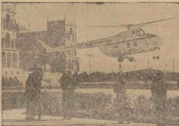
W centrum Baku — stolicy Azerbajdżańskiej SRR — na Placu Lenina budowano lotnisko dla helikopterów. W ciągu kilku minut helikopter przewozi pasażerów do nowego ośrodka przemysłowego Sumgait.