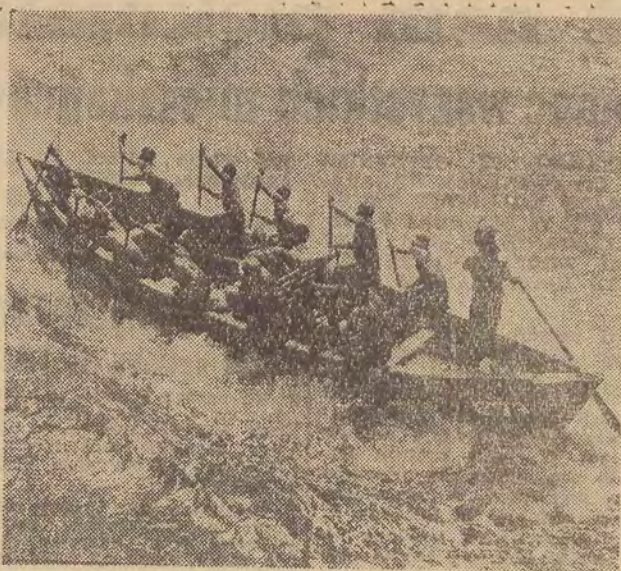
Na zdjęciu: ghańscy wioślarze wprawnie pokonują spienione przybrzeżne fale.