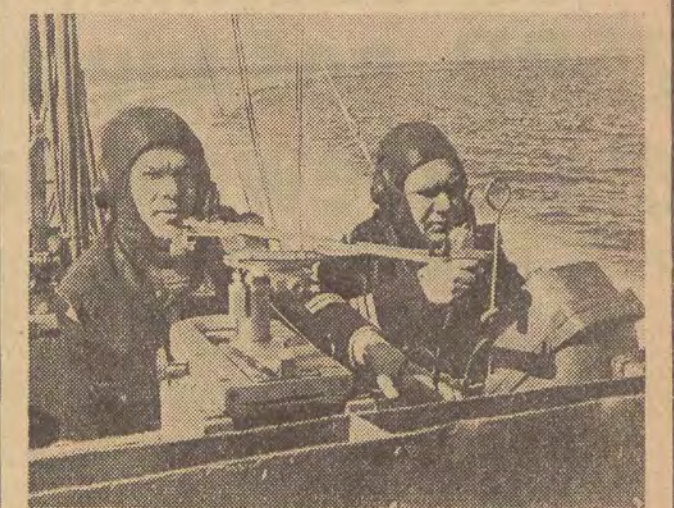
Zwycięska Armia Radziecka — armia pokoju. Na zdjęciu: taktyczne ćwiczenia ścigaczy na morzu.