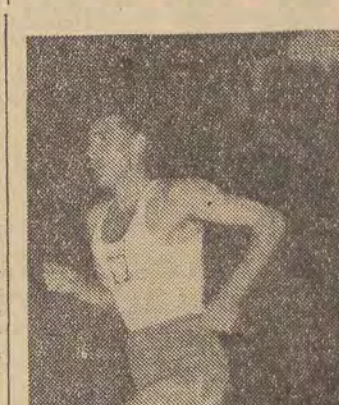
Oto - Zdzisław Krzyszkowiak, złoty medalista z Rzymu. Przez 10 lat swej kariery szukał specjalności w biegach długich. Był rekordzistą na wielu dystansach, z wyjątkiem biegu na 3 km. Zapalczywy człowiek. Jest wielkim przyjacielem Zimnego, ale nie może pogodzić się z myślą, że rekord Polski na 3000 m należy do Kazia. Postanowił zaatakować ten wynik. Zobaczymy w sobotę czy uda mu się to uczynić.

Mityng lekkoatletyczny na stadionie Startu rozpocznie się o godz. 17, wystąpieniem poetety Władysława Broniewskiego, który przeczyta wiersz specjalnie napisany przez siebie na tę uroczystość, a poświęcony pamiętnym wydarzeniom 1905 r. i weteranom walk rewolucyjnych.