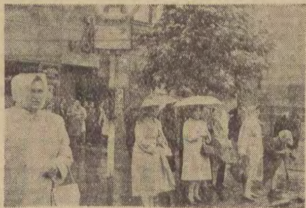
Jak deszcz to wiadomo, że z „dziewiątką“ jest najgorzej. Pod mostem kolejowym na Zdrowiu ulewny deszcz