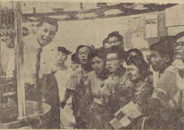
Przed kilku dniami otwarta została w Tokio radziecka wystawa handlowo-przemysłowa. Na zdjęciu: zwiedzający z zainteresowaniem przyglądają się pracy automatycznej maszyny tkackiej.