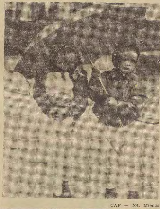
CAF — fot. Miedza

Ziemia lubuska słynie przede wszystkim z pięknych krajobrazów. Liczne jeziora, lasy, wzgórza i piękne zakątki stanowią nie lada atrakcję dla turystów szukających wypoczynku w ciszy, w kontakcie z naturą. Nie wszyscy jednak wyjeżdżają w te okolice tylko dla wypoczynku. Np. Związek Młodzieży Socjalistycznej z terenu Łodzi i województwa rozlokował w tym rejonie kilka obozów szkoleniowo-wypoczynkowych dla swojego aktywu. Również Zarząd Wojewódzki Stowarzyszenia Ateistów i Wolnomyślicieli umieścił nad pięknym Jeziorem Sławskim swój kurs dla młodzieży i aktywu.