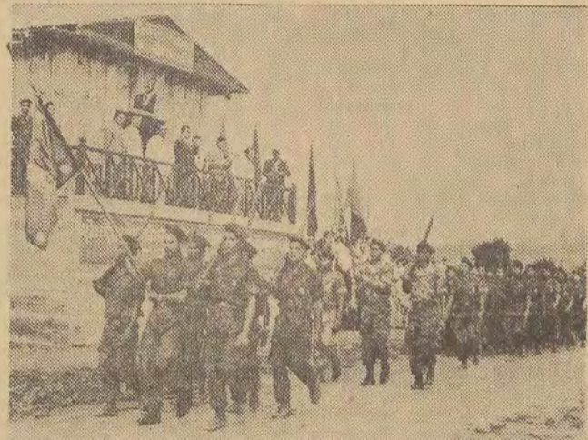
Naród laotański obchodził 9 sierpnia I rocznicę rozpoczęcia walk wyzwoleniecnych w Vientiane. Na zdjęciu: defilada oddziałów wojskowych w Phong Sawan (prowincja Xieng Khomang).