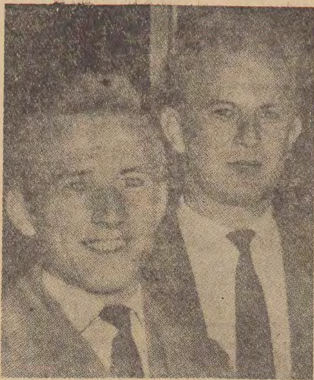
Katolik i Szczerzyński