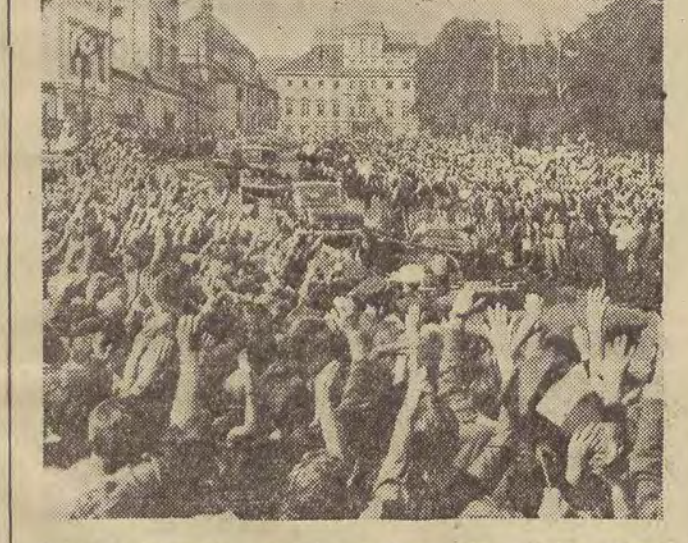
Polska delegacja partyjno-rządowa na ulicach Pragi.

z Polski odsłownie udekorowane. Ponad szosą przeciętno dziesiątki transparentów. „Na Odrze i Nysie jest również nasza granica” — czytamy na jednym z nich. Przed miastem Władysław Gomuła i Józef Cyrankiewicz (Dalszy ciąg na str. 2)