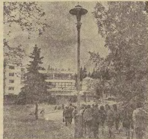
Pierwszy etap to Ęmokovec z licznymi domami wczasowymi i wypoczynkowymi oraz „elek tryczką”, którą można dotrzeć do przełęczyny Strpskiego Plesa lub do Tatrzanskiej Łomnicy.

Piękna polska jesień wyręcza w tym roku lato, darząc nas słońcem i suchą po godą. Kto tylko może stara się więc o kilka dni wolnych (z nie wykorzystanego jeszcze urlopu lub na poczet urlopu przyszłorocznego) i rusza na tzw. „łono przyrody”. Niektórzy (jak np. c. ze zdjęcia poniżej) w pogoni za jej urokami, przekroczyli nawet granice państwowe, udając się na wędrowkę po Słowackich Tatrach.