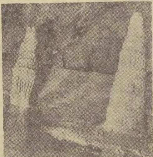
Uświeconym celem wszystkich wycieczek są wszakże Bielańskie Jaskinie zaskakujące przy byszą różnorodnością kształtów i barw swych stalaktytów.