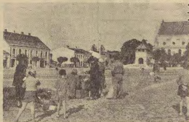
Główny plac w Poddebicach, czyli rynek wypełnia się ty lko w dni targowe.

I nagle w centrum pejza żu hamuje z piskiem wielki autobus o nowoczesnych li niach. Wobec otaczających rynek parterowych domków sprzed wieku wydaje się co najmniej rakieta międzyplani netarna.