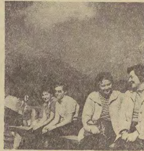
Choć wycieczka trwała zaledwie parę dni, pozostawiła na pewno niezatarte wrażenia...