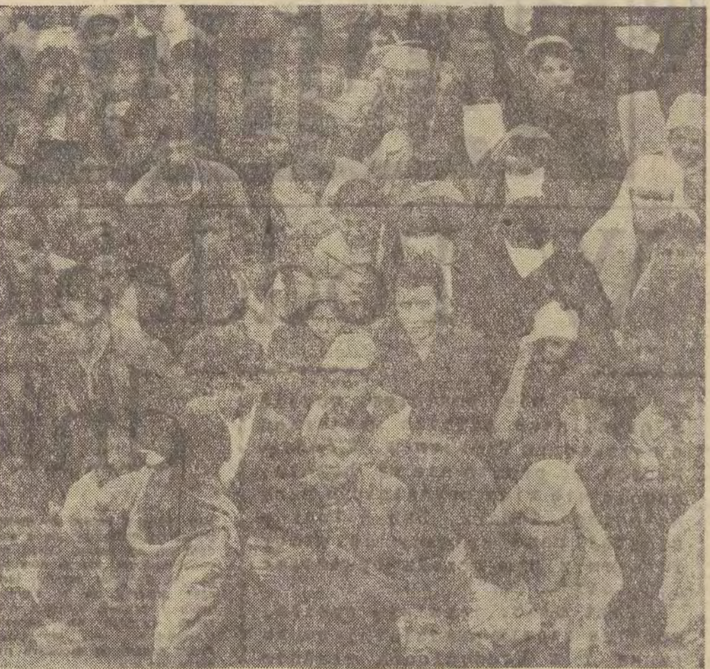
Algieria, Angola, Kenia, Mozambik, Rodezja. Nadal skandaliczne stosunki panują w niezależnym państwie — Związku Afryki Południowej, gdzie 3 miliony białych kolonizatorów gnąbi i

W najtrudniejszej sytuacji znajduje się jednak 25 kolonii i terytoriów zależnych o łącznej liczbie ludności 65 milionów. Trwają one jeszcze w kolonialnym jarzmie W. Brytanii, Portugalii, Francji i Belgii. Największe z nich — to