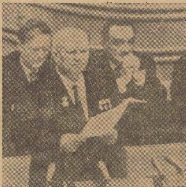
Na zdjęciu: Nikita Chruszczow na trybunie CAF — telefot

Dziś, 19 bm. Gribel składał będzie dalsze wyjaśnienia dotyczące całokształtu jego działalności. (b2)