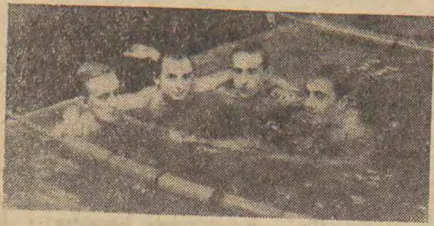
Rekord Polski w sztafecie 4x100 m stylem grzbietowym ustanowili pływacy WKS Orzeł podczas kontrolnych zawodów...