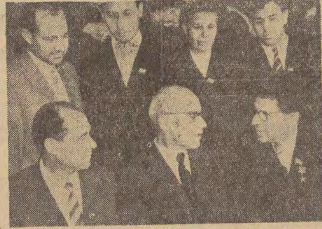
I sekretarz KC KPZR Władysław Gomułka rozmawia z delegatami obwodu włodzimierskiego na XXII Zjazd KPZR podczas przerwy w obradach.

NOWY JORK (PAP). — Związek Radziecki przedłożył w Zgromadzeniu Ogólnym NZ formalny projekt rezolucji w sprawie przywrócenia Chińskiej Republice Ludowej przy sługujących jej praw w ONZ. Projekt rezolucji uznając konieczność tego kroku i wskazując, że tylko przedstawiciel Chin Ludowych posiada kompetencję reprezento-