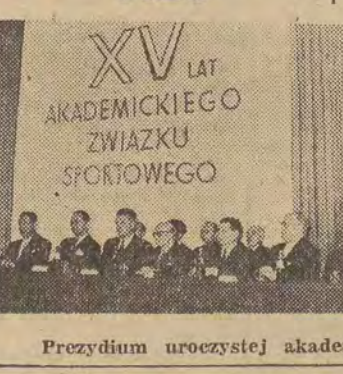
Prezydium uroczystej akademii.