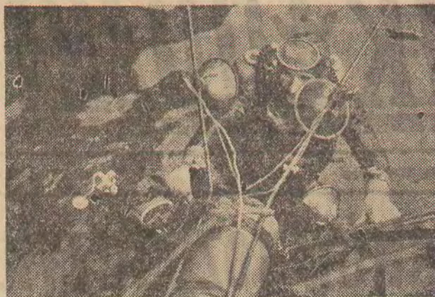
Na zdjęciu: pletwonurkowie powoli zanurzają się w wodzie.

WARSZAWA (PAP). — Na zapoczątkowane próby zakreślone podwodne zostały nowe metody badawcze części podwodnych turbin i turbin wodnych przy pomocy telewizji przemysłowej. M. in. przeprowadzono przy pomocy specjalnych kamer badania wirnika tzw. turbiny kapłana bez potrzeby jej odwodnienia. Specjalna podwodna kamera telewizyjna wykonana przez Warszawskie Zakłady Telewizyjne była prowadzona pod wodą przez pletwonurków — inżynierów.