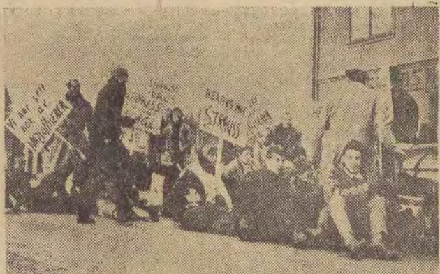
Studenci norweskiej protestując przeciwko przybyciu mini- stra obrony NRF Straussa rozsiadli się na ulicach, który- mi miał przejeżdżać z lotniska do Oslo samochód, wiozą- cy ministra.

Policji norweskiej z wielkim trudem udało się usunąć demonstrującą młodzież akademicką. Na zdjęciu: demonstranci zatrzymują samochód, w któ- rym znajduje się minister obrony NRF Strauss.