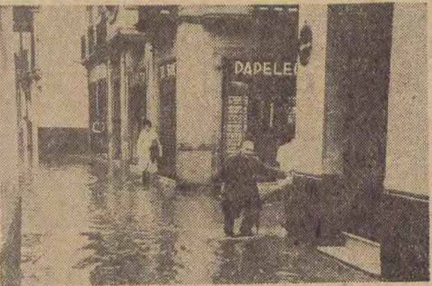
Na zdjęciu: stolica Andaluzji — Sewilla zalana wzbzranymi falami rzeki Gwadalkiwir.

PARYŻ (PAP). Powódź wywołana ulęwnymi deszczami przybrała katastrofalne rozmiary w Sewilli. Dwie osoby zginęły, a tysiące mieszkańców pozabawione są dachu nad głową. Webrane wody zalaly wschodnie dzielnice miasta. Nieczynne jest lotnisko cywilne. Samoloty kierowane są na pobliskie lotnisko amerykańskich sił zbrojnych.