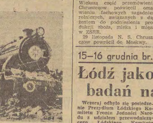
Wykolejony express na trasie Madras — Bombaj. Katastrofa ta pociągnęła za sobą śmierć 3 osób, a 8 zostało ciężko rannych.