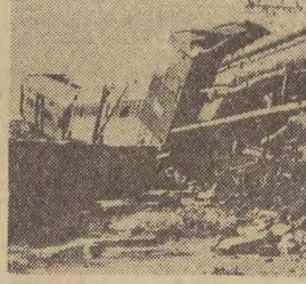
Wykolejony express na trasie Madras — Bombaj. Katastrofa ta pociągnęła za sobą śmierć 3 osób, a 8 zostało ciężko rannych.