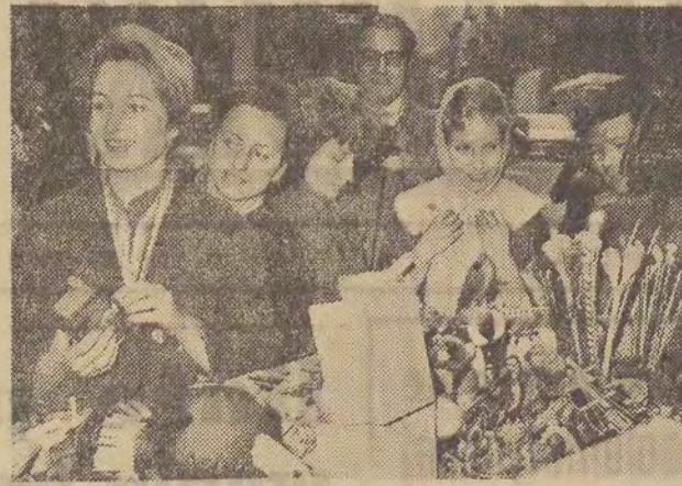
Na zdjęciu: „Mazowszanki” zwiedzają chińską dzielnicę w Nowym Jorku.