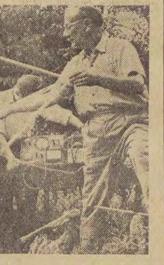
Nowoczesna radiostacja do obserwacji rakiet i pojazdów kosmicznych w Rakosliget (Węgry). Zainstalowano tu ruchomą paraboliczną antenę, która pozwala odbierać sygnały z pojazdów kosmicznych pracujących na krótszych falach.