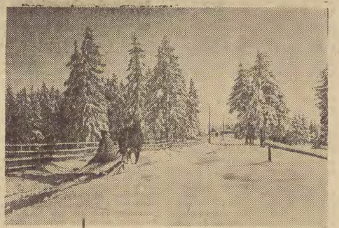
Na zdjęciu: widok z Gubalówki.

Za Egzekutywę Komitetu Łódzkiego PZPR I sekretarz (—) M. Tatarówna-Majkowska