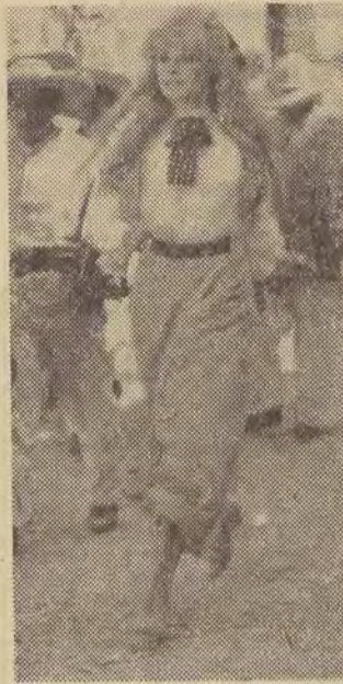
Brigitte Bardot przebywa obecnie w Meksyku, gdzie nakręca film z okresu rewolucji meksykańskiej pt. „Viva Marie”. Wraz z Brigitte Bardot gra w tym filmie Jeanne Moreau. Na zdjęciu: Brigitte Bardot w jednej ze scen nowego filmu.