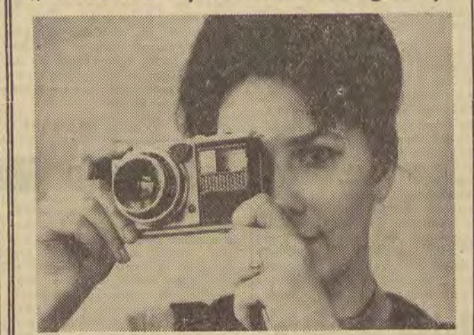
Znane zakłady optyczne w Leningradzie, produkujące aparaty fotograficzne i amatorskie kamery filmowe, przedstawiają na tegorocznych międzynarodowych targach i wystawach nowe typy aparatów. Na zdjęciu: aparat fotograficzny „Woschod” wyposażony w mechanizm do półautomatycznego nastawiania czasu ekspozycji.