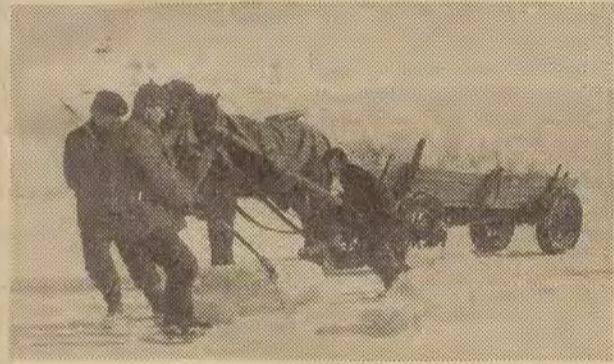
Mróż jest świetną okazją do poczynienia zapasu lodu naturalnego na okres letni. Na Wiśle trwają obecnie prace przy wyrąbaniu lodu, który zostanie użyty w lecie dla celów chłodniczych.

Aż dziw bierze jak bardzo ludzie stali się drażliwi. Byłe powody wytrącają ich z równowagi. Niekiedy wydaje się, że nie żyliśmy jeszcze w tak drażliwych czasach jak obecnie. Drażliwość i obraźliwość. Aktor obraża się, jeśli krytyk napisze o nim niepocholebną recenzję. Kierownik biura, jeśli jego podwładny pozwoli sobie na najniewinniejszą nawet uwagę o stylu jego pracy, sprzedawca stojący za ladą pod napisem „Klient ma zawsze rację”, nie wybaczysz mu (klientowi), gdy ten skrytykuje coś w jego sklepie.