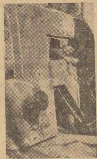
waczy, ani utrwalaczy, ani filmów w pełnym asortymencie fotograficznych, ani wywoły-

Słynna na cały świat NRD-owska firma ORWO (dawniej „Agfa”) produkująca odczyniki chemiczne, a znana w Polsce przede wszystkim z doskonałej jakości materiałów fotograficznych: filmów, chemikałów i papierów, postanowiła zafundować sobie i Łodzi — neonową reklamę na szczyście domu przy ul. Piłsudskiego 275. Potężne, dwumetrowej wysokości litery montuje brygada z warszawskiej spółdzielni „Lumen”. Cały neon będzie miał powierzchnię 60 m kw.